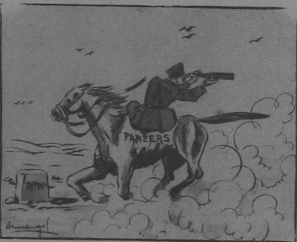
Mi jaca galopa y corta el viento...