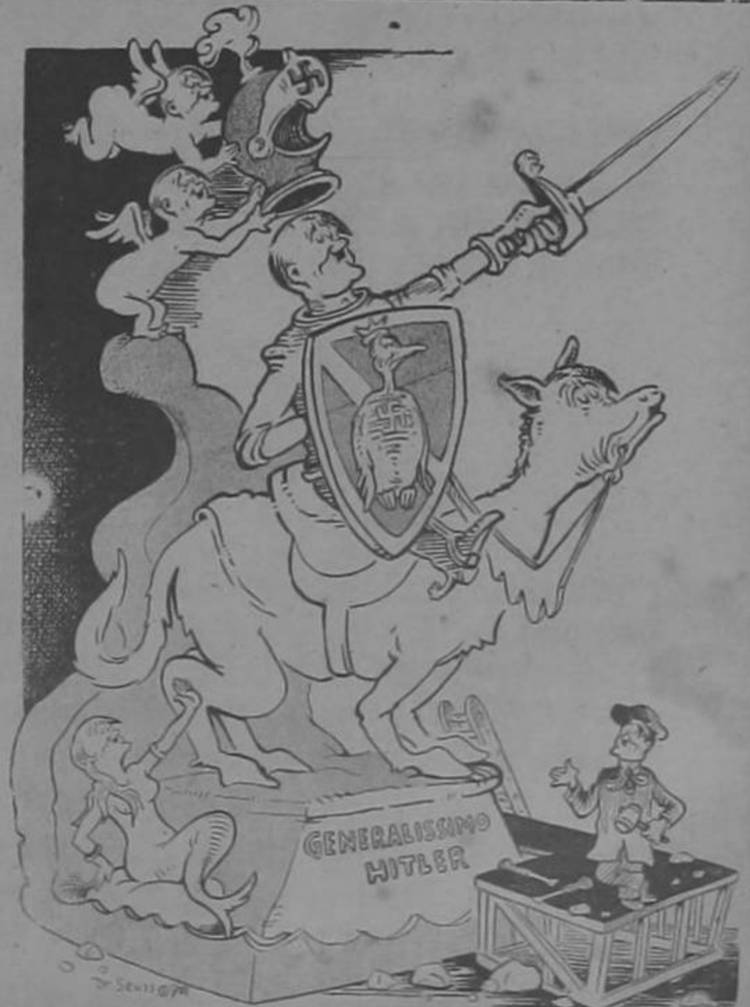
Su más ferviente admirador