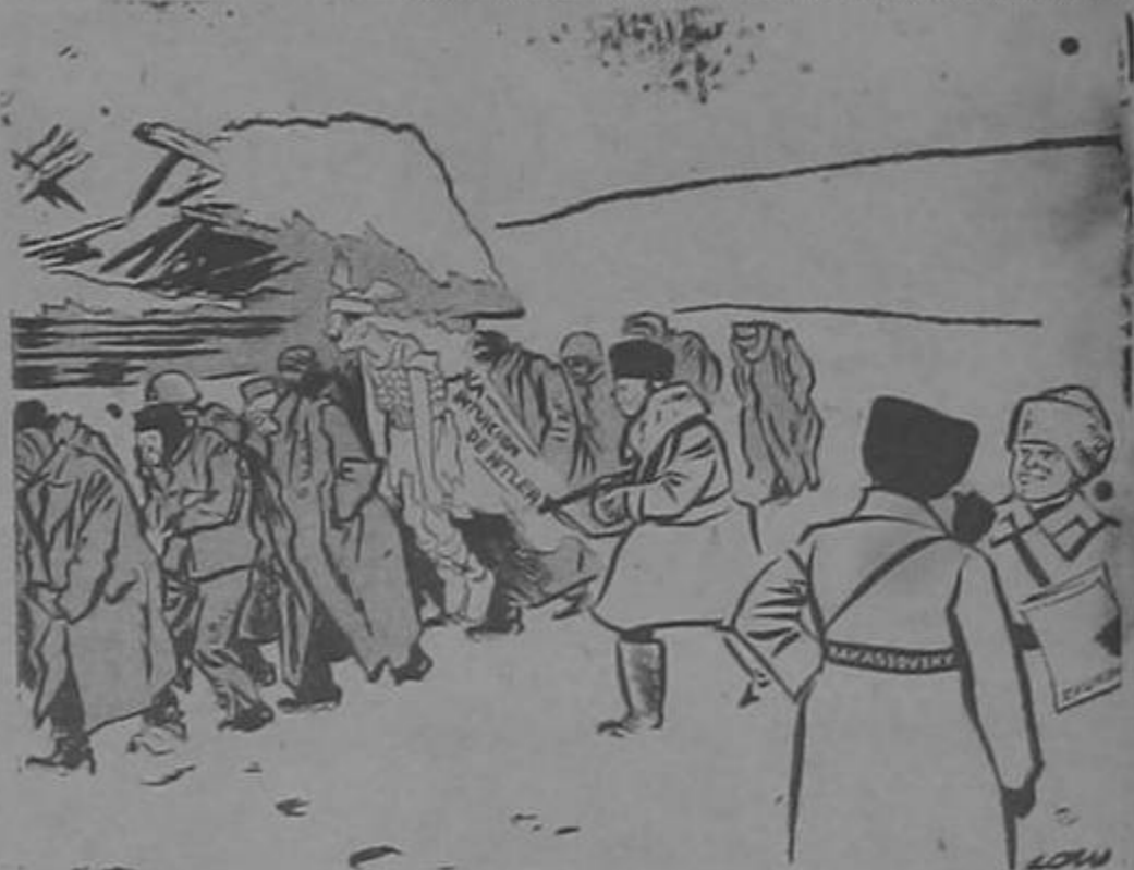
"Fíjate lo que nos traen hoy!"