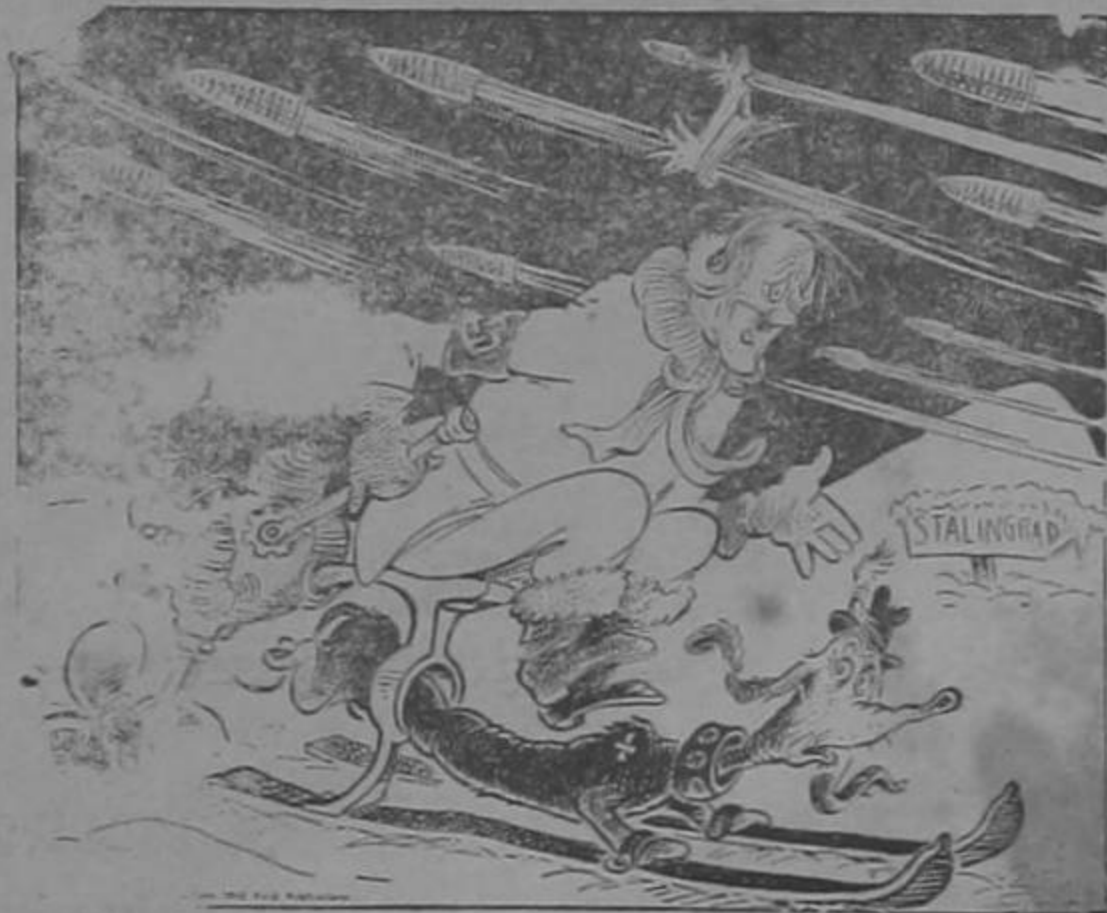
Cuidado! Que voy a echar marcha para atrás...!