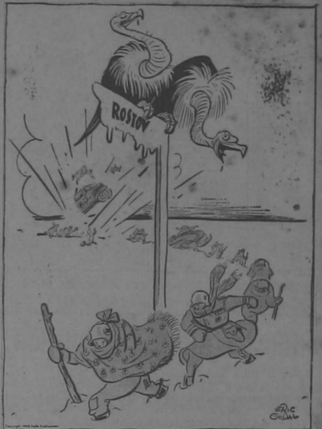
"Homer! Despiértate! Ya están otra vez de regreso!"

Se queja don Leoncillo de que hay su diferencia entre el trato del Presidente Cortés al candidato Calderón Guardia, al trato del Presidente Calderón al candidato Cortés. Oleeee!