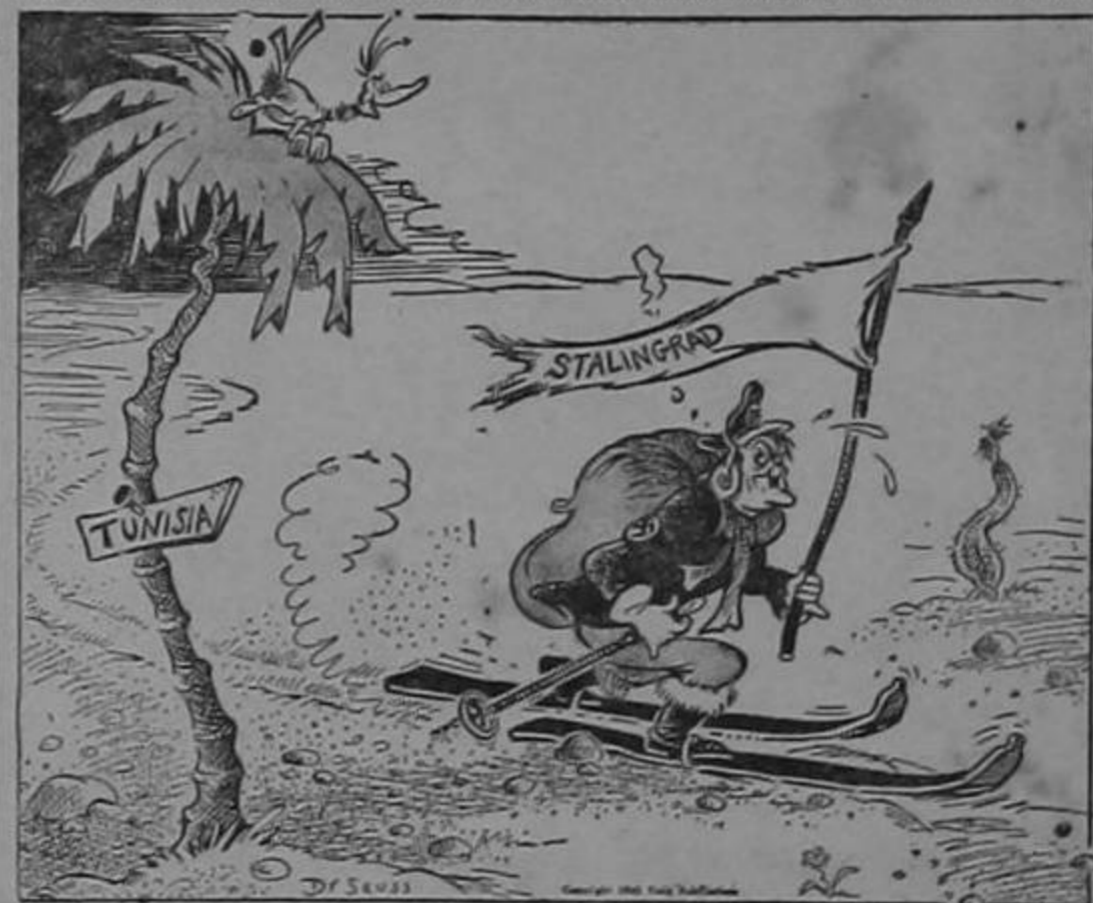
¿Se ha perdido Ud., amigo?

De venta: La Despensa, El Colmado y las principales pulperías.