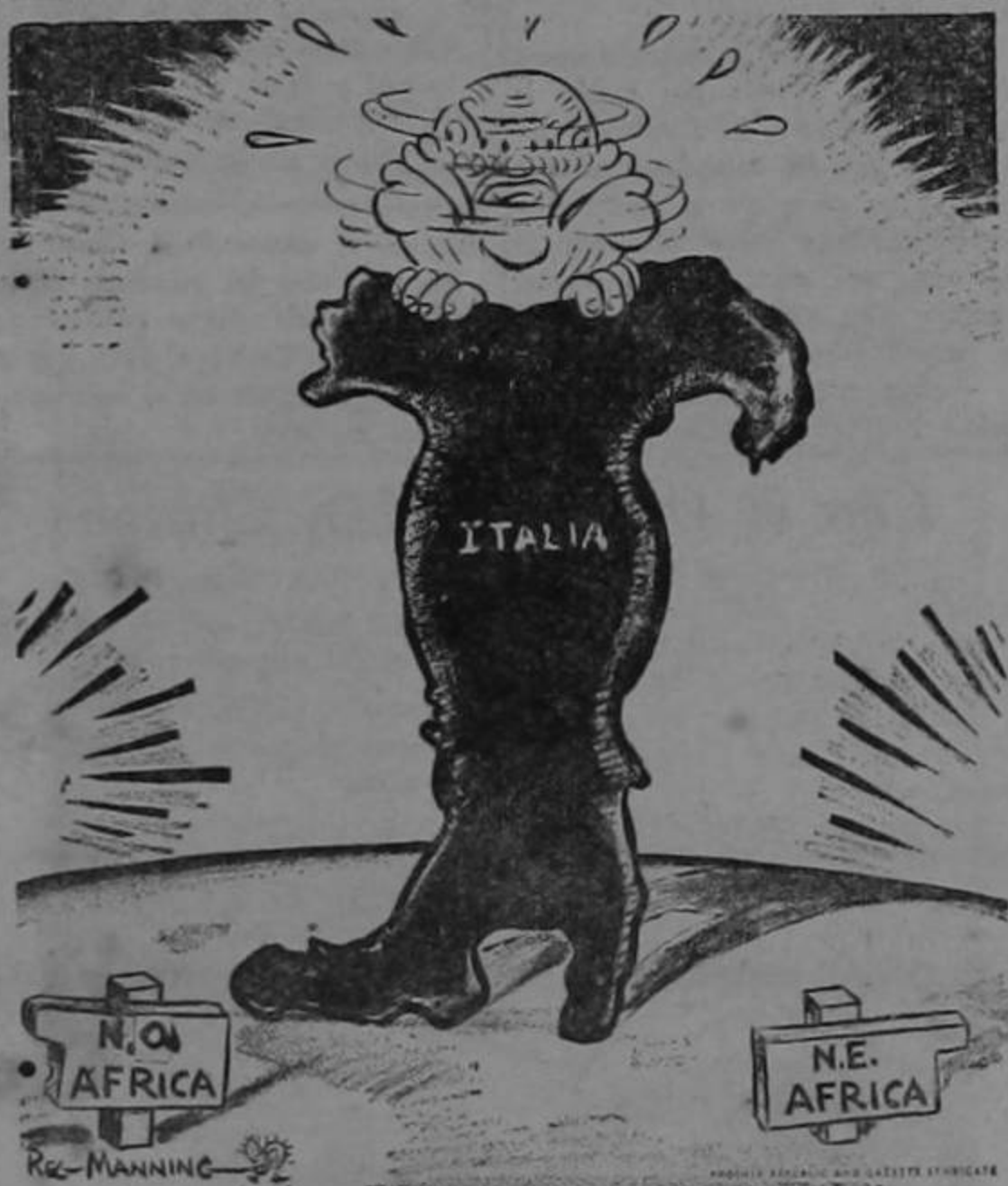
El zapato aprieta...

—Preciso es que la humildad vacile cuando la divinidad sucumbe.