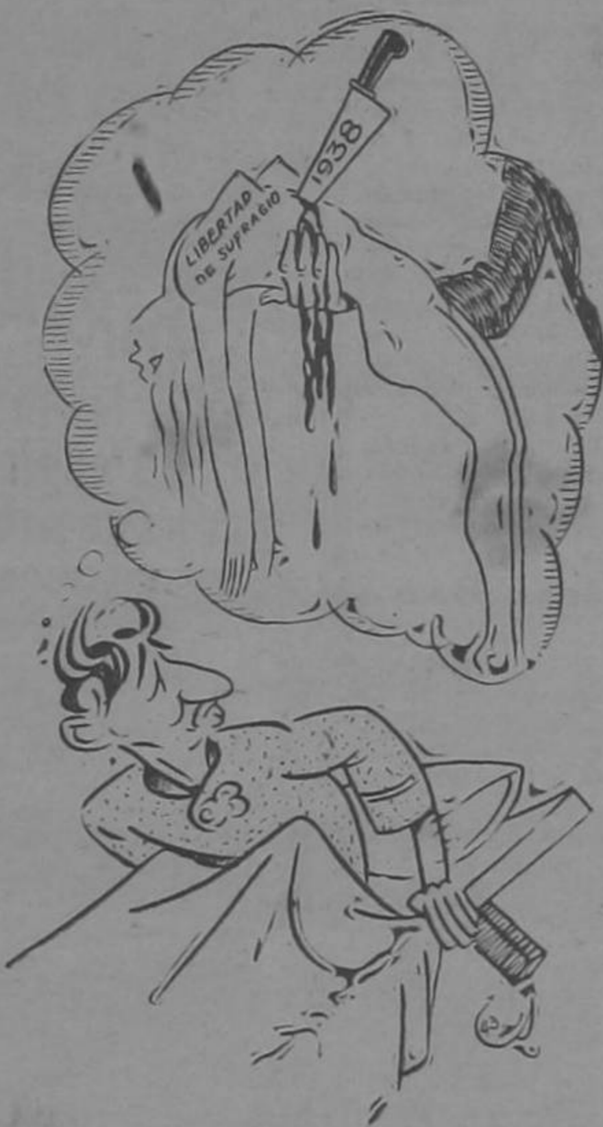
Don León: Si nó, que lo diga yo!!