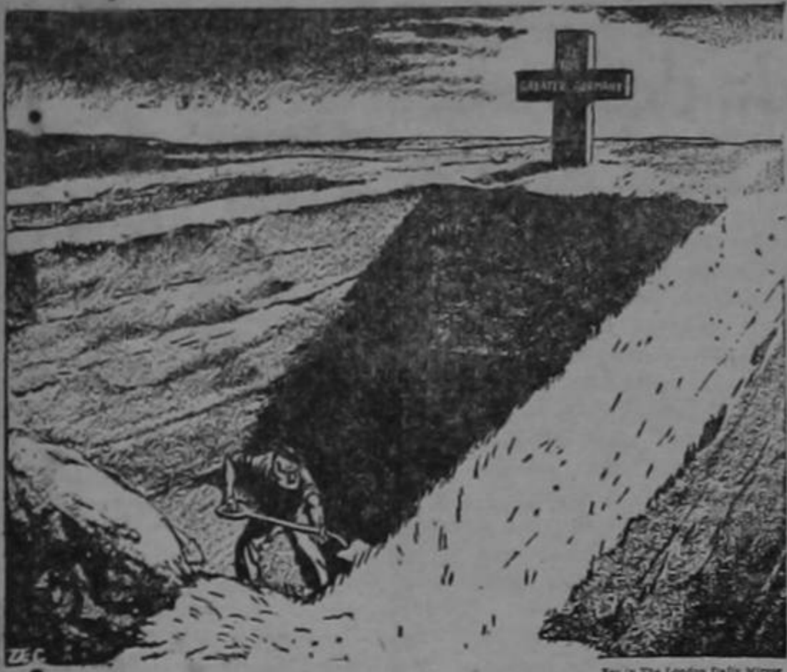
Preparando la tumba...