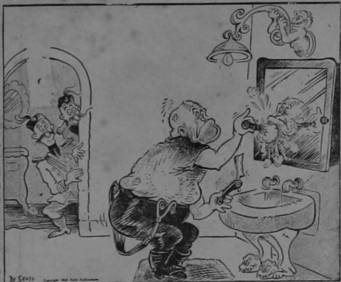
"El pobre! Está tan nervioso que solamente se atreve a afeitarse en su reflejo en el espejo!"