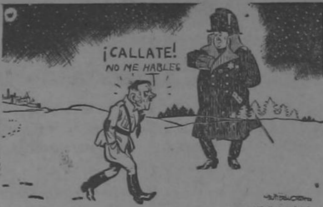
Napoleón: —Qué, otra vez?