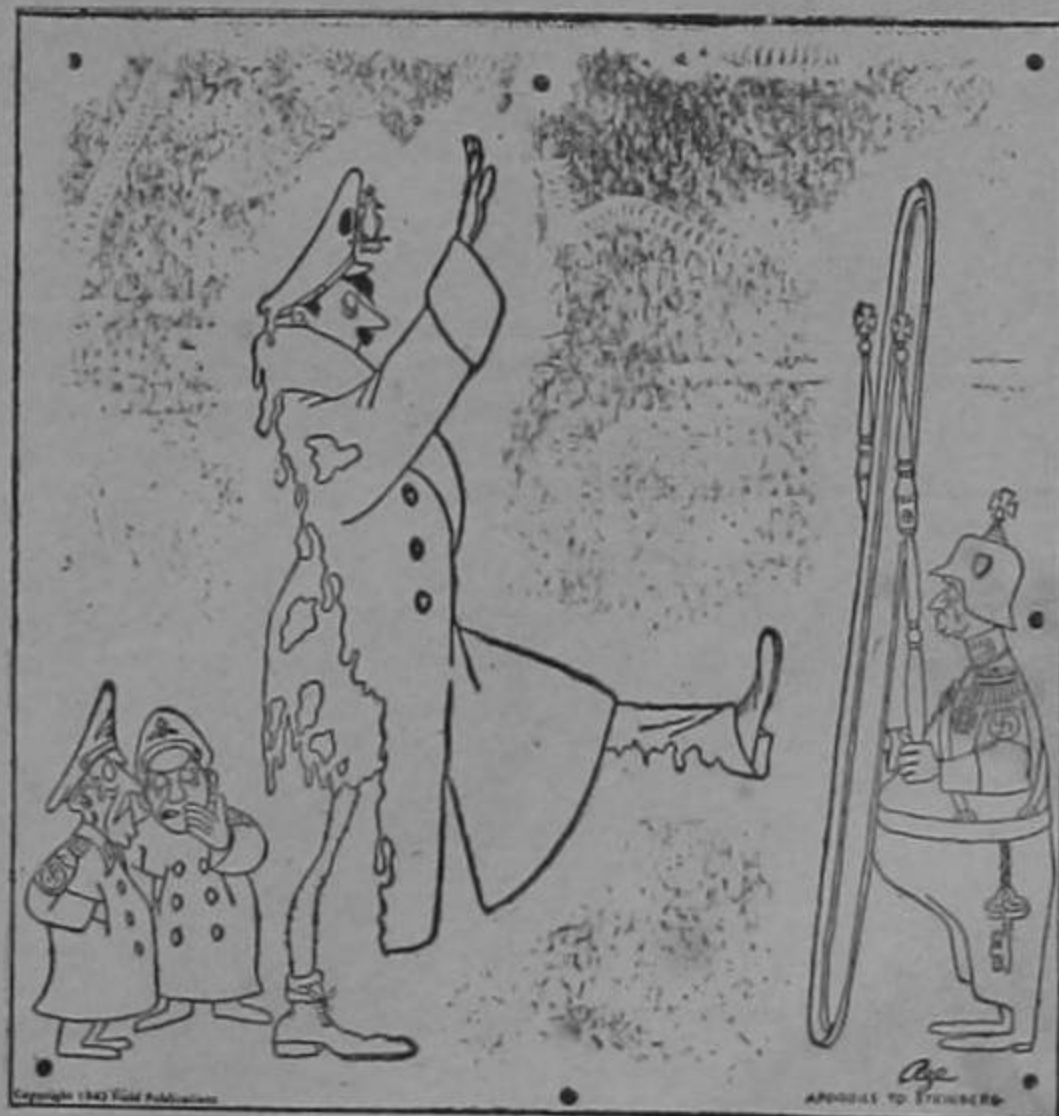
"Debía darse la vuelta..."

—"Mi cliente, señores magistrados, vive hace dos años con una mujer a quien adora, y de la cual tiene un hijo. Se me dirá, quizás, que dicha mujer es su amante y que está casada con otro. Pero señores, puedo asegurarles que mi cliente espera, para regularizar su situación, nada más que la muerte del marido..."